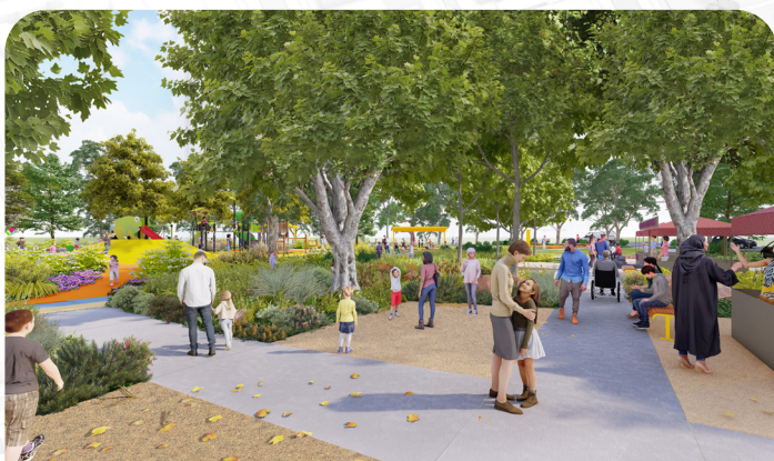
Del nuevo parque central de 5000 metros cuadrados que abrirá a mediados de 2026