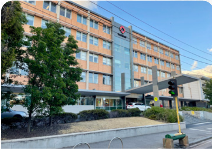
Đi xe điện một đoạn ngắn đến bệnh viện Alfred