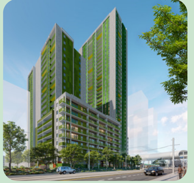
Racecourse Road'un sanatçı izlenimi (Bina 3BC)