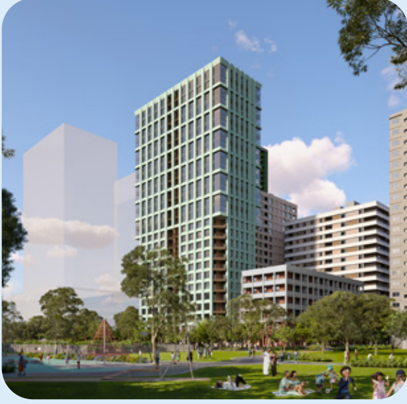
Debneys Park'ın sanatçı izlenimi (Bina 4CD)