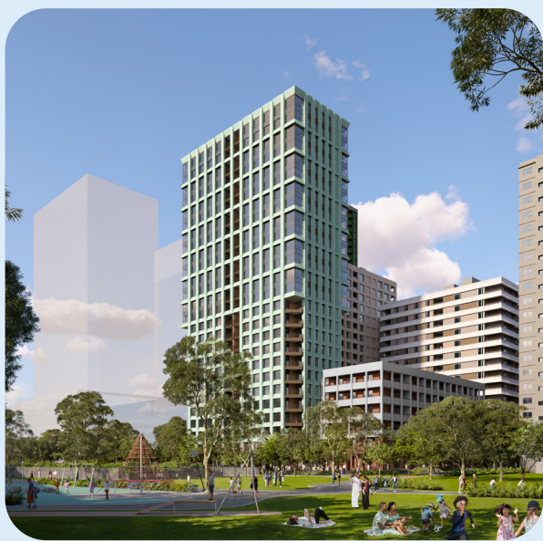
Debneys Park (4CD 棟) 的設計構思圖