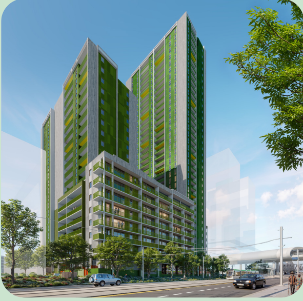
انطباع فني عن Racecourse Road (المبنى 3BC)