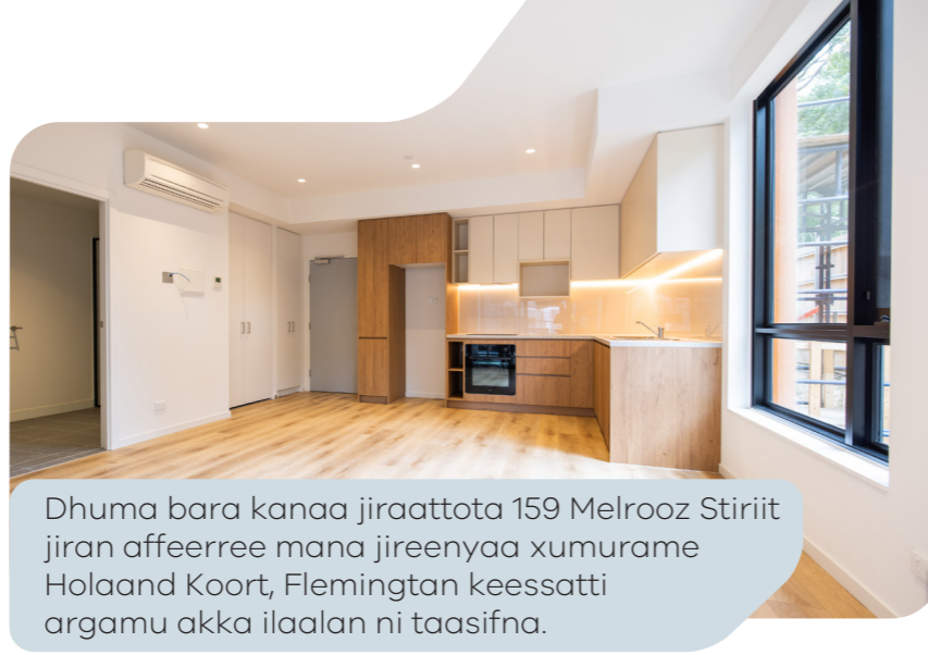
Dhuma bara kanaa jiraattota 159 Melrooz Stiriit jiran affeerree mana jireenyaa xumurame Holaand Koort, Flemingtan keessatti argamu akka ilaalan ni taasifna.

Walakkeessa bara 2026 hanga Guraandhala 2028tti jiraattota waliin walitti dhiyeenyaan hojjechuun mana fedhii keessan guutu argamsiisuuf ni hojjenna, manneen naannoo keessan jiran dabalatee.