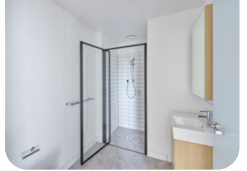
Homes Victoria's Brightonን ዳግመ ህንጻታት Flemington ተመሳሳሊ አሰራርቶን ብሉጽነትን አለዎ።