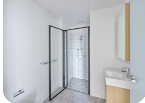
Homes Victoria 在 Brighton 和 Flemington 的开发项目展现了相似的特色与品质。