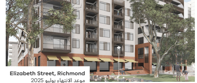
Elizabeth Street, Richmond موعد الانتهاء يوليو 2025