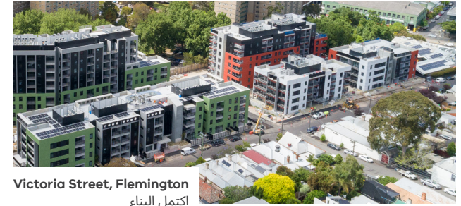
Victoria Street, Flemington إكتمل البناء