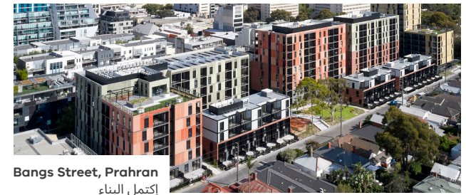
Bangs Street, Prahran إكتمل البناء